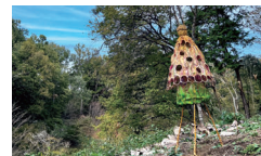
立川 真理子 「はじまりのはじまり」