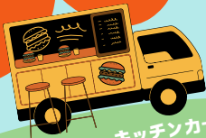
キッチンカーもくるよ