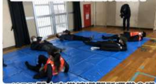
はるひ野小中学校避難所運営会議