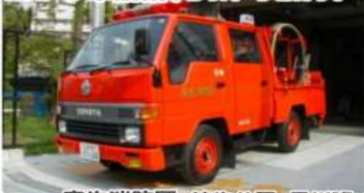
麻生消防団 柿生分団 黒川班