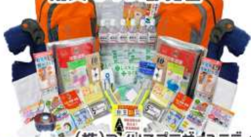
(株)アイリスプラザユニティ