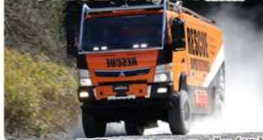
三菱ふそうトラック・バス(株)