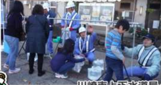
川崎市上下水道局