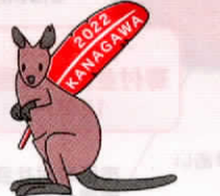
共同募金PR大使 野毛山動物園の オグロワラビー 「オハナ」