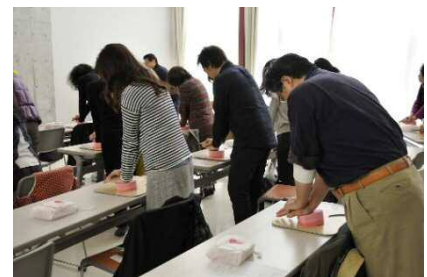
昨年の実習の様子

お互いの命を守るため、既に受講、体験された方も含め、ぜひご家族の皆様で(特にご夫婦や中学生以上のお子さんと一緒に)受講されることをお勧めします。小さなお子様をお連れになったの参加も歓迎です。奮ってのご参加申し込みをお待ちしています。