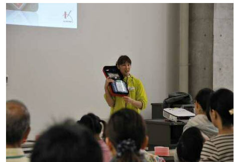
昨年の講習の様子